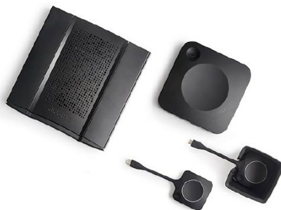
Balco ClickShare Conference CX シリーズ（本体と Button）