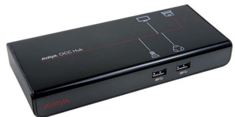
▲Avaya One Cable Connect Hub

OCC Hub は、オンライン会議時に外部デバイスと PC を USB ケーブル 1 本で接続するための「USB ハブ」です。2 つの USB 入力と 1 つの HDMI 出力を搭載し、カメラ、マイクスピーカー（またはヘッドセット）、モニターなどを接続できます。